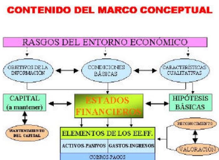
GRÁFICO 1: MARCO CONCEPTUAL

El objetivo de la información financiera , que se compone de estados financieros principales, notas y cuadros complementarios, es suministrar información acerca de la situación financiera, los resultados y los flujos de efectivo de las entidades empresariales. Esta información tiene, como condiciones básicas , que se emite regularmente por imperativo legal y tiene un carácter predominantemente financiero.