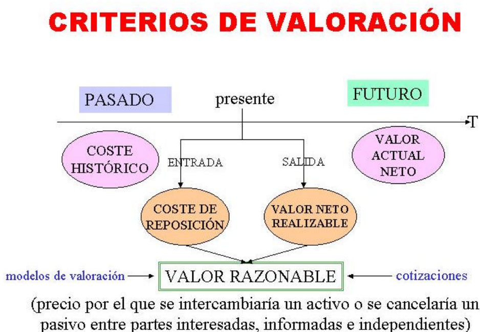
GRÁFICO 2: EL VALOR RAZONABLE

El valor razonable se utiliza obligatoriamente en todos los instrumentos financieros que la empresa posea, salvo que sean préstamos o partidas a cobrar originados por ella (por ejemplo no se utiliza en las partidas de clientes) o bien sean instrumentos de deuda mantenidos hasta el vencimiento. No obstante, los cambios de valor en los instrumentos financieros se tratan de diferente forma en función de la intención que la empresa tenga respecto a los mismos. Así: